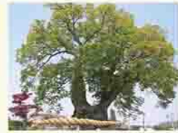
国指定特別天然記念物 東根の大ケヤキ

私が通っていた小学校は、東根城の跡地にあり、樹齢1,500年といわれる大ケヤキがシンボルになっています。