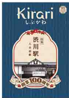
令和3年度発行「Kirariしづかわ」

申込方法 申請書(秘書室または市ホームページにあります)に必要事項を記入し、郵送または持参で秘書室(〒377-1