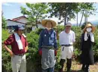
活動中のスタッフ

NPO法人北毛ささえあいの会は、高齢者や障害者の地域における生活を支える活動をしています。主な事業として、北毛保健生協の組合員を対象に、自宅の片付けや草刈りなどを行う生活支援事業と、外出時に見守りや介助を必要とする人の通院や買い物を支援する福祉有償運送事業を行っています。現在、約26人のスタッフで運営していますが、同じ会員でも支援する内容は毎回違いますので、相手の状況をできるだけ理解してサービスすることを心掛けています。