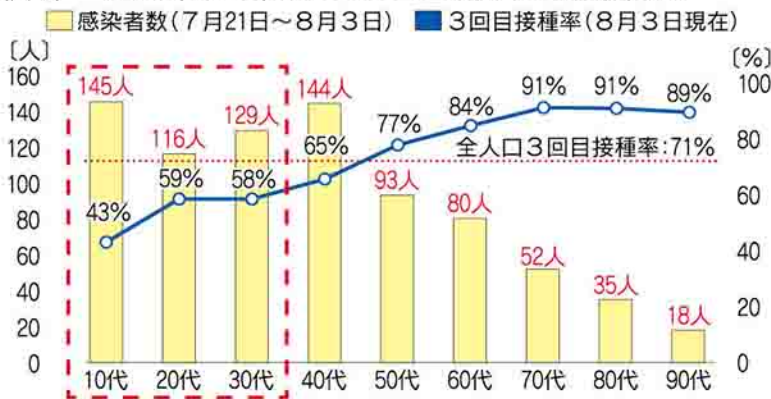
(図1) 洪川市の年代別ワクチン接種率と感染者数