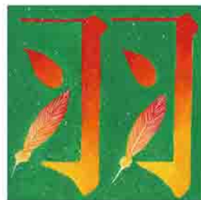
作品名：羽 種別：絵文字 サイズ：縦20cm×横20cm