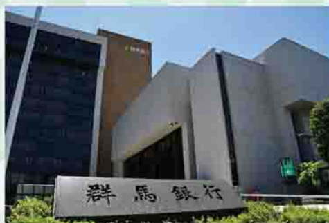
群馬銀行本店(前橋市)

市との連携などを実施してきました。これからも地域の皆さんとの関係を深め、これまで培ってきた私たちならではの強みを活かしつつ、「つなぐ」ことへの取り組みにより、市との連携を図っていきます。