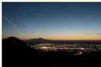
金峰山方向からの横手盆地の夜景

渋川市へは、妻の出身である群馬で、人々の交流ができる場所を作りたいと思い移住してきました。今はキャンプ場を経営しながら、さらに