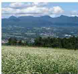
行幸田そば畑のそばの花