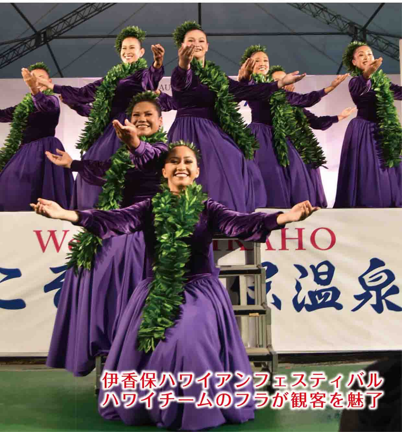
伊香保ハワイアンフェスティバル ハワイチームのフラが観客を魅了