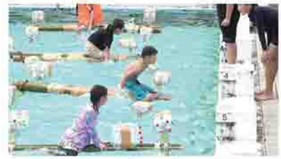
『手作りリカダでプールを渡れ』 問合せ先 本秘書室(☎☎2182)