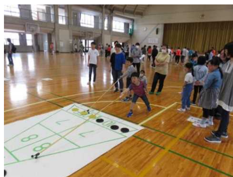
軽スポーツフェスティバル