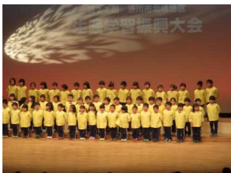
生涯学習をすすめる会 振興大会