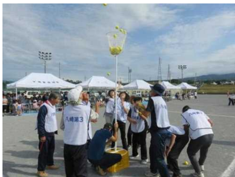
北橋秋のスポレク祭