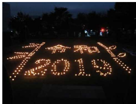
たちばな竹の里フェスティバル