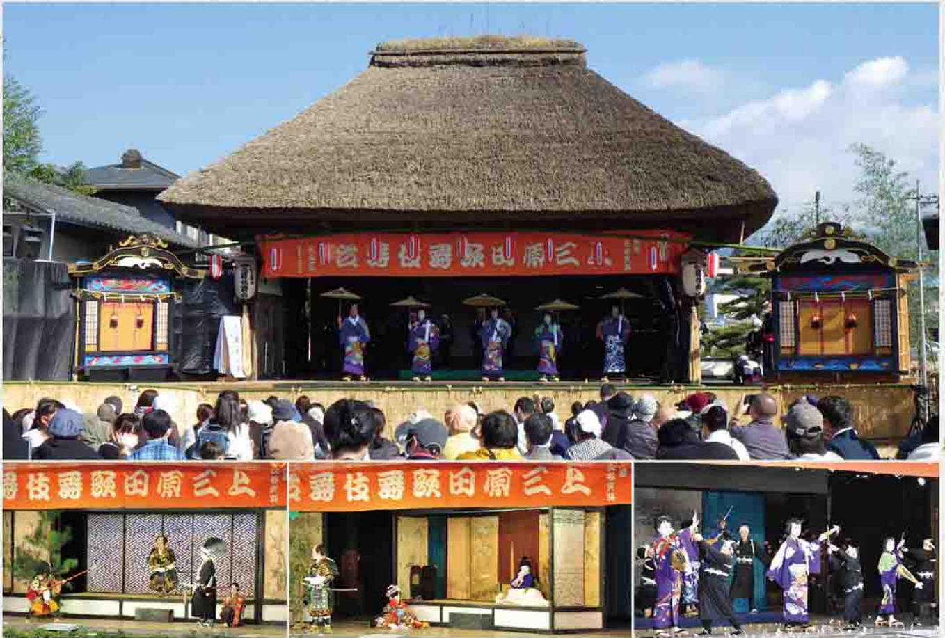
(別表) 上三原田の歌舞伎舞台2022プログラム