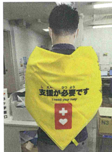
図2.災害時ヘルプバンドナ 使用方法