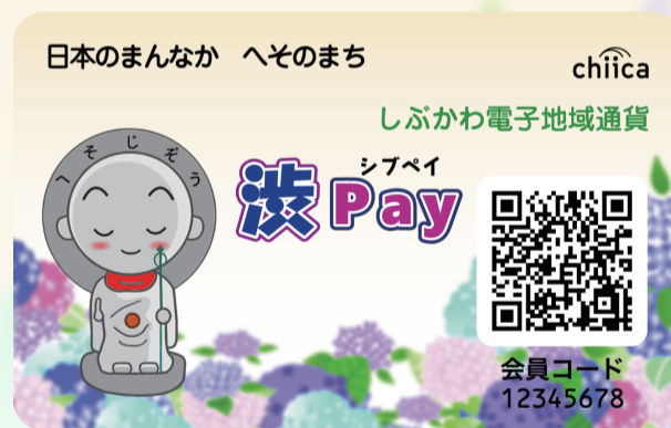
専用カード(タテ・ヨコ2種類)