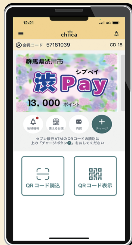
スマートフォン アプリ