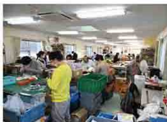
利用者の作業風景

当法人は、平成24年から「就労継続支援A型事業所・群馬エレクトクス」を運営しており、今年で10年目を迎えます。就労支援A型は、一般就労の難しい障害や難病のある人が、雇用契約を結んだ上で一定の支援がある職場で働くことができる福祉サービスです。当事業所では、現在、知的障害のある人を中心に、20代から50代までの16人が通所しています。