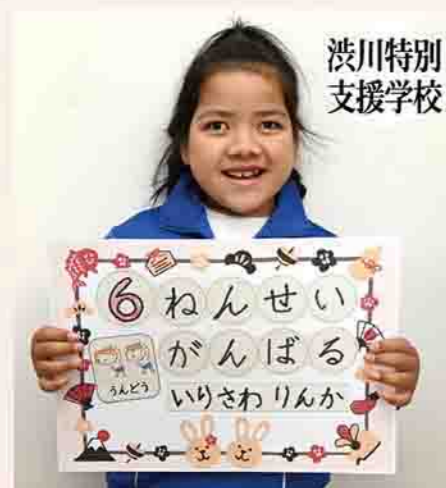
渋川特別 支援学校