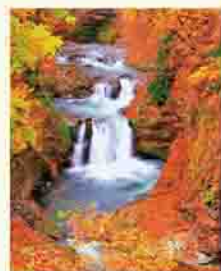
広瀬川の名勝 鳳鳴四十八滝

私のふるさととは、宮城県仙台市です。私が暮らしていたのは新川という所で、仙台市街から車で約1時間、近くには作並温泉があります。土地が平坦で暮らしやすく、近くを流れる広瀬川の水がとてもきれいで、子どもの頃は川で泳いだり、カジカを捕まえたりして遊びました。ふるさとの慣習で覚えていることは、お葬式の日には3食お餅を食べることで。あんこ餅、からみ餅、ずんだ餅など数種類のお餅を食べました。