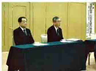
県などからの委託を受けて行った講演会の様子

群馬県生活支援の会は、あらゆる社会的弱者の生活を支えるための就労支援などを行う団体です。生活保護受給者や母子家庭、障害のある人、高齢者の就労支援のほか、罪を犯した人の更生の手助けをしています。平成24年の設立以来、100人以上の人に就労のお手伝いをしてきました。幅広い職種の事業者と付き合いがありますので、カウンセリングをしながら、その人の適正に合った仕事を紹介します。仕事をしなくても見つからない、生きていくのがつらいという人は、気軽に相談してください。