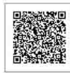
▲市ホームページ はこちらから

入場券には、各人の投票 所が記載されています(左の 入場券イメージ図の赤枠が 該当)。自分の投票所を入 場券で確認して、該当の投票 所で投票してください。 また、市内の全投票所・投 票区域の詳細については、 市ホームページに掲載して います。左の2次元コード からホームページにアクセ スして確認してください。