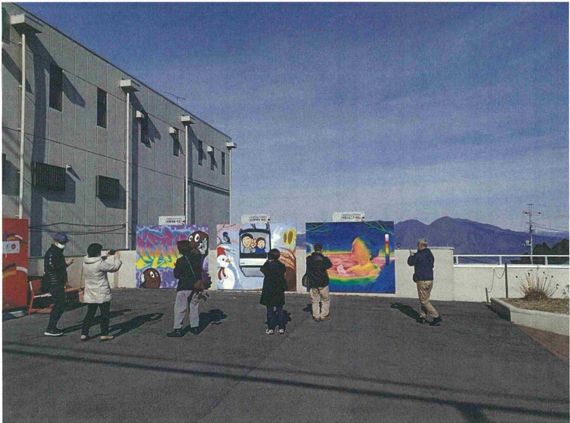
市営八千代橋駐車場