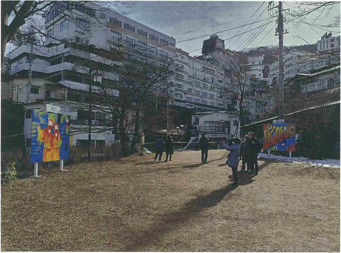
石段アルウィン公園内多目的広場