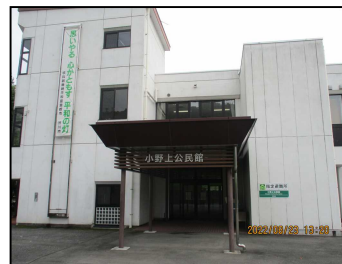
【小野上公民館HP】です 「公民館だより」もご覧になれます