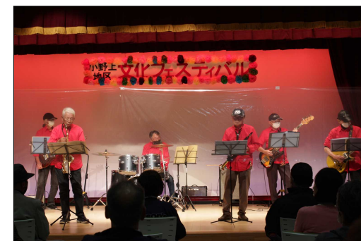
日ごろの学習活動の集大成 【小野上地区文化フェスティバル】