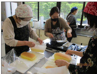
【調理室】 台湾カステラ 作り教室