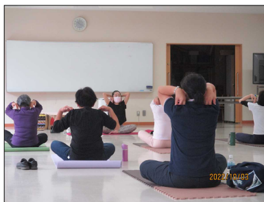
【講義室】 ボディメンテナンス ヨガ教室