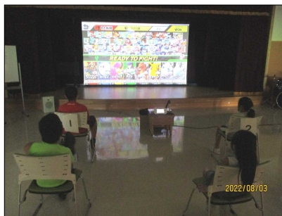
【ホール】 eスポーツ交流会