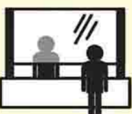
▲入場券のイメージ図