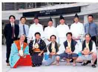
保存会のメンバーたち

下南室太々御神楽保存会は、下南室赤城神社春の例祭での神楽奉納を中心に、20人が伝統を受け継ぎ、次代へ伝える活動を行っています。無表情の面を付けて感情を表す神楽は熟練が必要です。笛・太鼓・舞手の息が合っこそ良い舞いができます。メンバーは30～60代と幅広く、息を合わせてお互いを尊重し、神楽の継承だけでなく、社会人として礼儀作法を学べる場にもなっています。