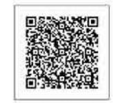
▲市ホームページはこちら

■ 投票所は入場券で確認できます 入場券には、各人の投票所が記載されています。自分の投票所を入場券で確認して、該当の投票所で投票してください。 また、市内の全投票所・投票区域の詳細については、市ホームページに掲載しています。