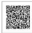
▲オミクロン株対応 ワクチン接種