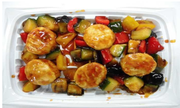
軟骨つくね黒酢あんかけ