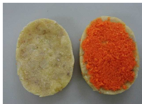
コロツケキャロットパティ