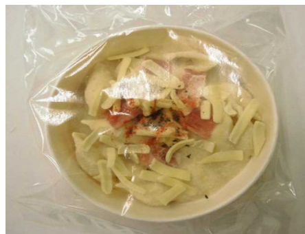
マカロニグラタン