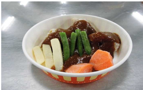
若鶏ステーキデミグラスソース添え