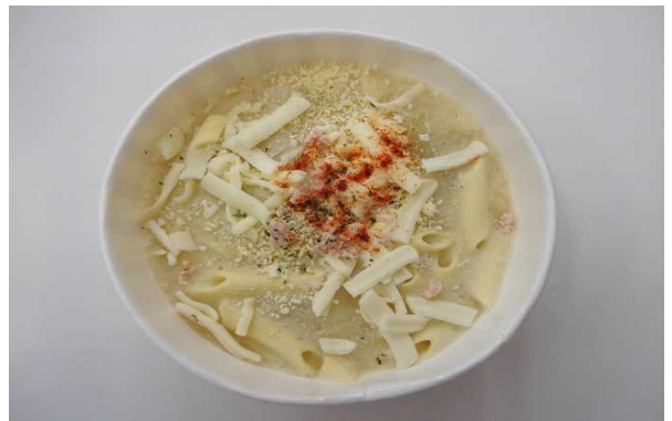
4種チーズグラタン