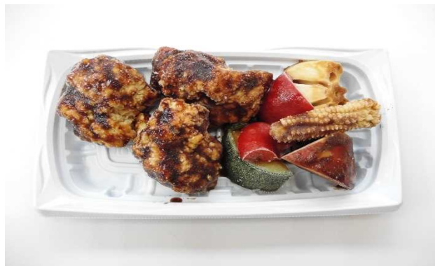
若鶏唐揚あんかけ