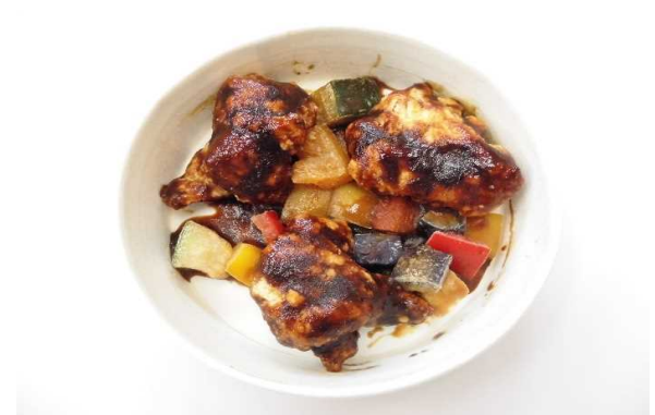
若鶏唐揚あんかけ