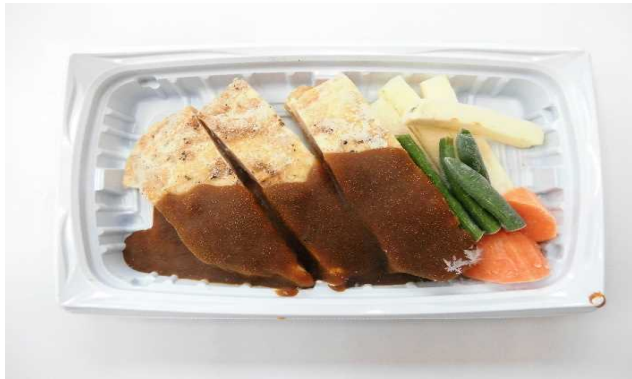
若鶏ステーキデミグラスソース添え