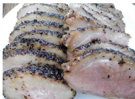
合鴨ペッパーロースト