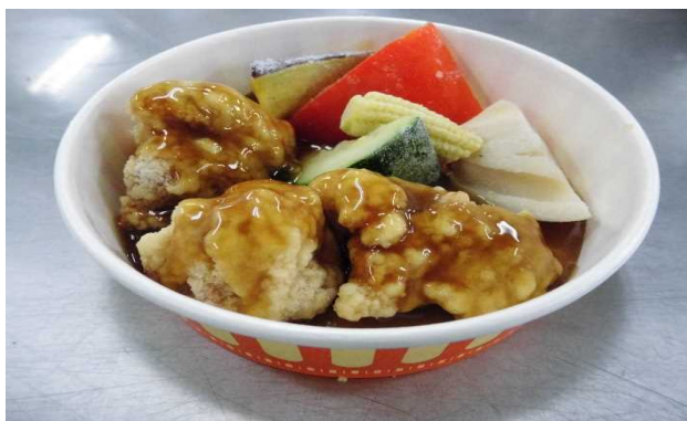
若鶏の唐揚甘酢あんかけ