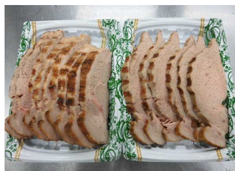
ローストポークスライス