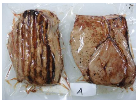
ローストポーク用