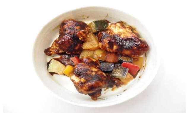
若鶏唐揚あんかけ