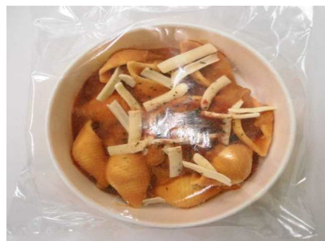
コンキリエマカロニ