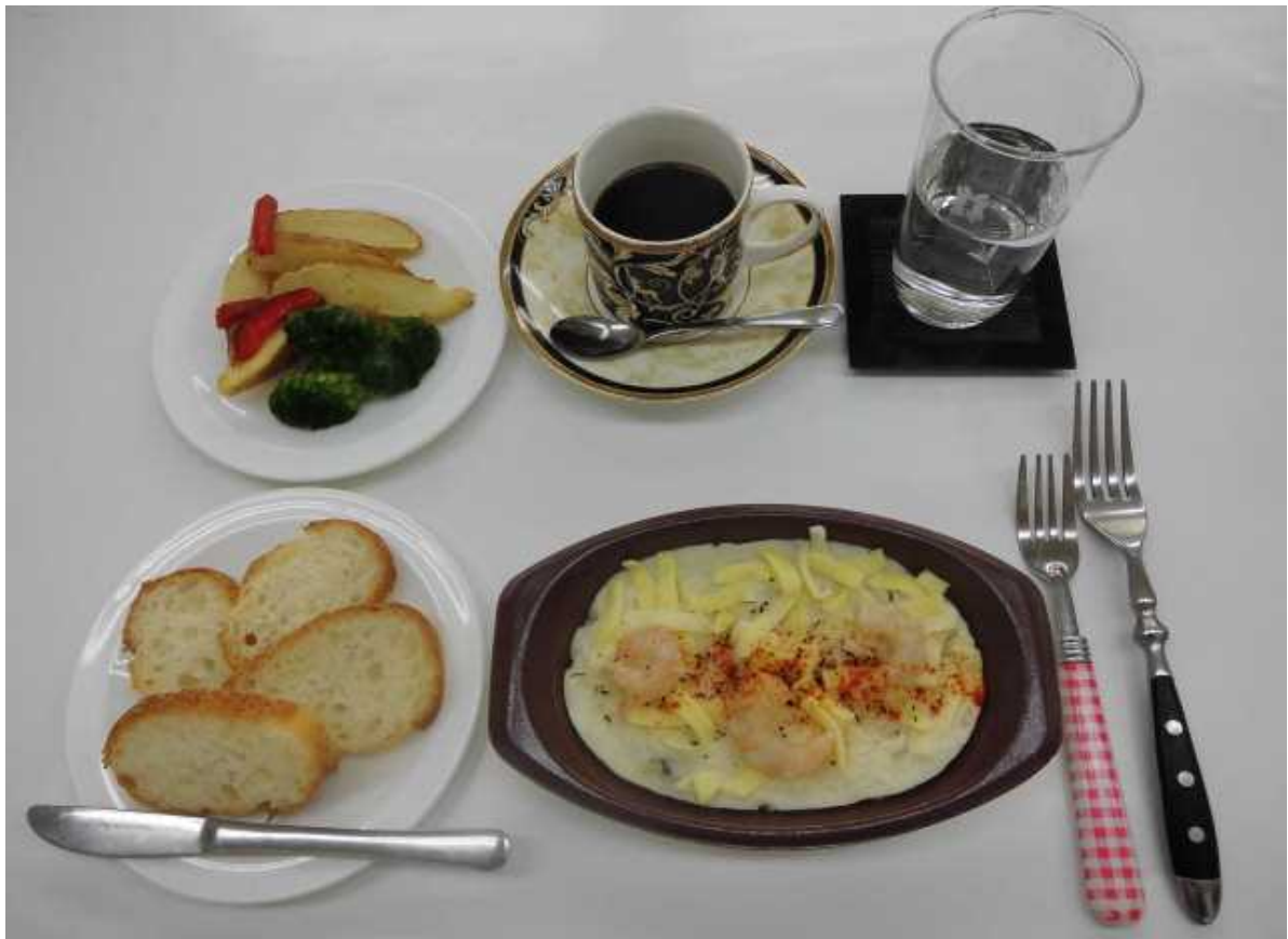
『エビグラタン』を使ったテーブルイメージ