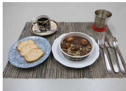
テーブルイメージ