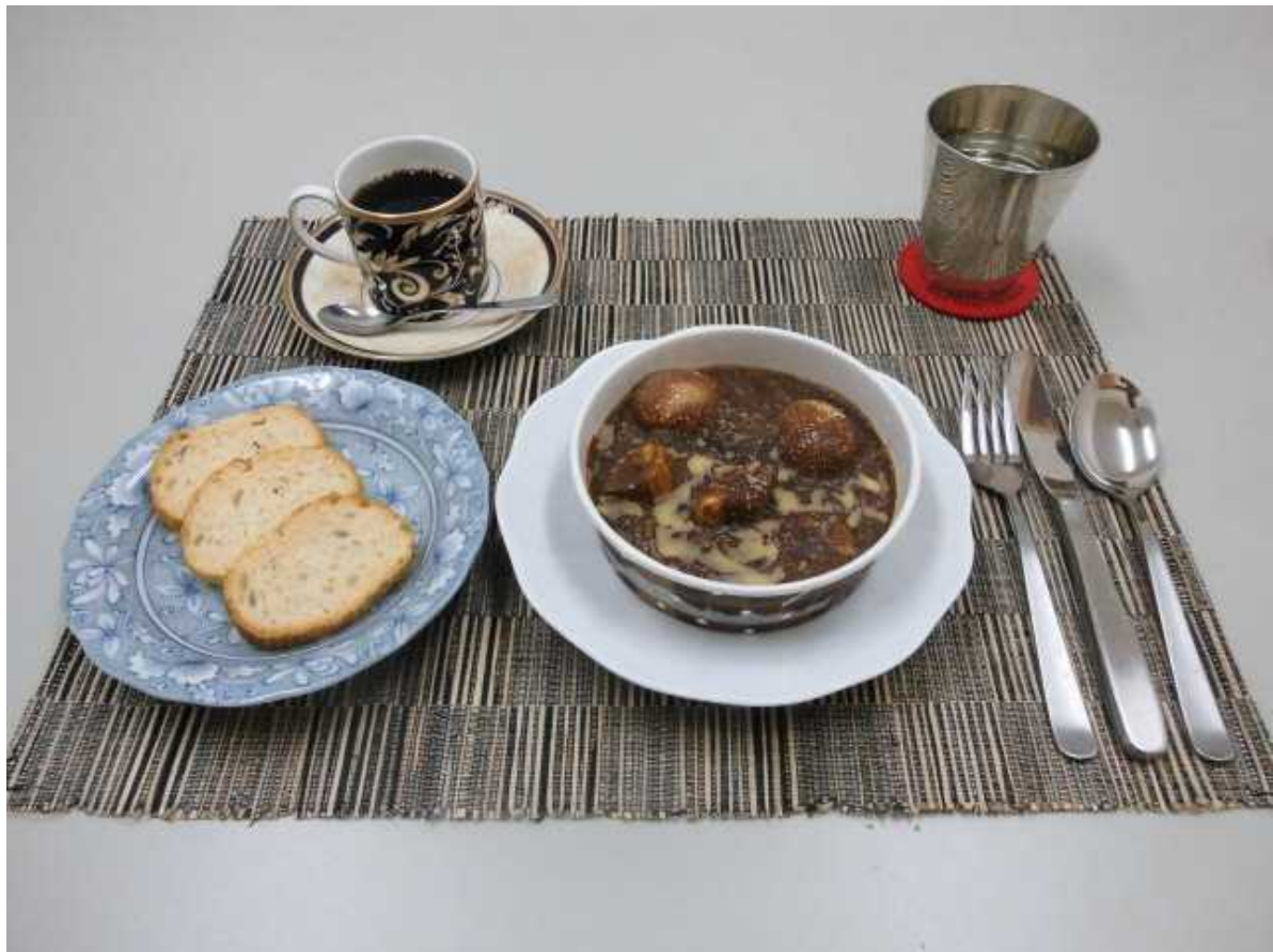
『ビーフシチュー』を使ったテーブルイメージ