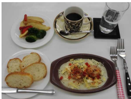
〈エビグラタン：盛り例〉