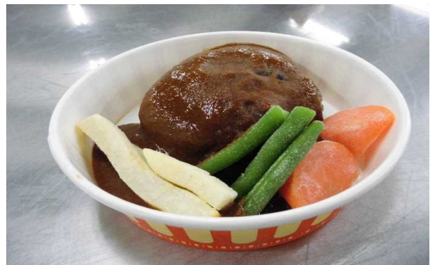
ハンバーグデミグラスソース添え