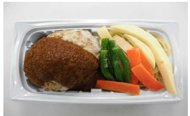
ハンバーグデミグラスソース添え