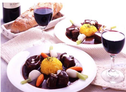
〈ビーフシチュー：調理例〉