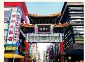
お薦めスポット「横浜中華街」

ふるさとの横浜市緑区白山町は、私が生まれた頃は、農業が盛んで、田畑が多い住宅地でした。現在は、マンションや大型団地、ハイテクパークが混在し、地域内を流れる鶴見川の対岸には、工業地帯が広がっています。電車で2駅のところに、横浜アリーナやラーメン博物館がある新横浜駅がありますが、観光のお薦めは、横浜中華街です。買い物を楽しめる横浜赤レンガ倉庫も近くにあるので、ぜひ、行ってみてください。