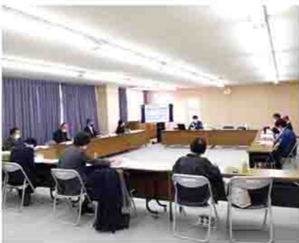
▶ 昨年の協議会の様子

年間570万トン(令和元年度推計値)の食品ロスが発生しており、そのおよそ半分が私たちの家庭から排出されています。これらは廃棄物の増加、処理に伴う温室効果ガスの発生などの環境問題につながっています。