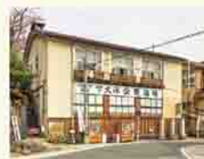
上山温泉の外湯 「下大湯共同浴場」

せっかく伊香保という素晴らしい温泉があるので、共同浴場を活用した外湯巡りなどができたら、日帰りで遊びに来たお客さんも、もっと楽しめるのではないかと思います。