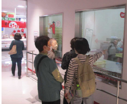
〈めんたいパーク群馬〉

最後に明太子の老舗かねふくの「めんたいパーク群馬」で明太子工場やつぶつぷランドを見学しました。