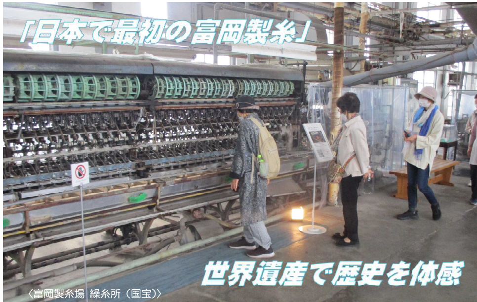
〈富岡製糸場 繰糸所 (国宝)〉