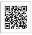
▲ホームページはこちら

への振り替えはありません ▽荒天の場合は中止 ※当日の午前4時30分ごろから開催有無を自動音声ダイヤル(050(3310)0451)で案内しますので確認してください ▽詳細は、左の2次元コードから(株)かんぽ生命保険のホームページを確認してください