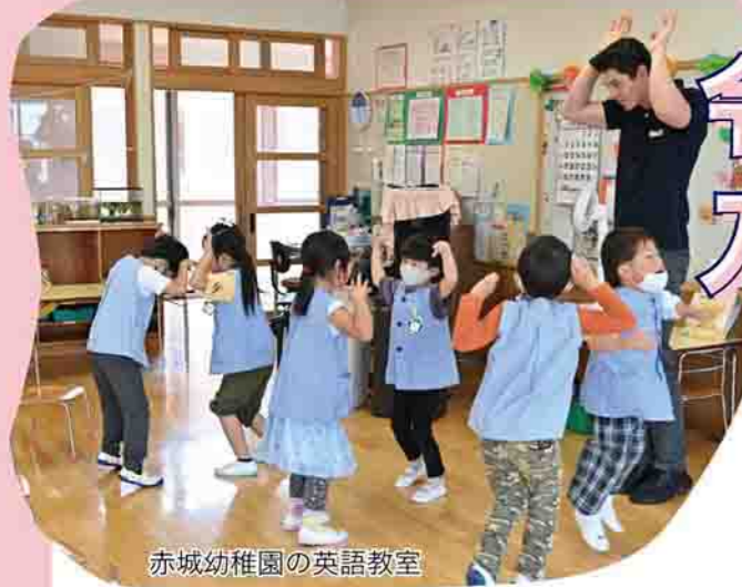
赤城幼稚園の英語教室

幼稚園、保育所、認定こども園の令和6年度入園児を募集します。各施設を利用する場合には、市の「認定」を受ける必要があります。お子さんの入園を希望する場合は、以下の内容を確認の上、手続きしてください。 詳しくは、 本 こども支援課(☎2415)へ。