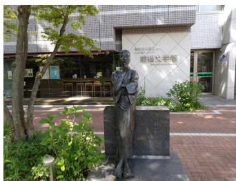
萩原朔太郎記念前橋文学館