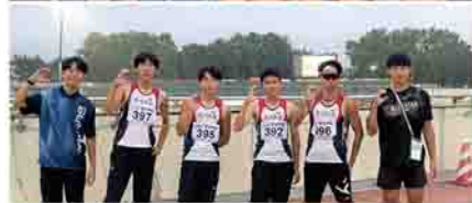
翔び立て若き翼 北海道総体 2023