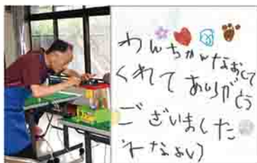
活動の様子と3歳の子どもの手紙

子どもたちの「ものを大切にする心」を養うことを目的に、壊れたおもちゃの修理を行っています。平成11年に開院し、現在12人のボランティアアドクターが、毎月第4土曜日に豊秋公民館で活動しています。