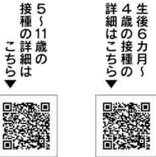
(別表4) 生後6カ月～11歳の人接種を受けられる医療機関一覧

その他 生後6カ月～11歳の人の接種の詳細は、右の各2次元コードを確認してください