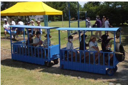
【丸太列車で公園内を一周】