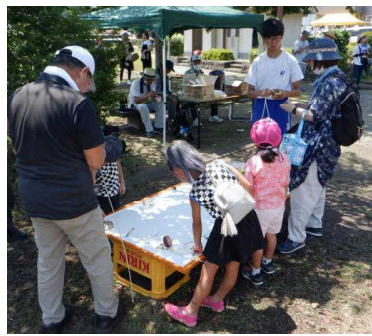
【上手にコマがまわったよ】