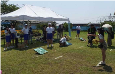
【輪投げでお菓子をゲット】

金島公民館地区人口 9,002人(男4,382人 女4,620人) 世帯数: 4,021世帯(令和5年7月末現在)