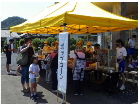
【ポップコーンを始めたよ】