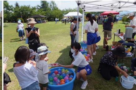
【ヨーヨーを2個つりあげたよ】