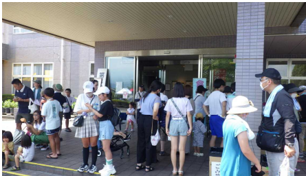
【飲み物がよく売れました!】