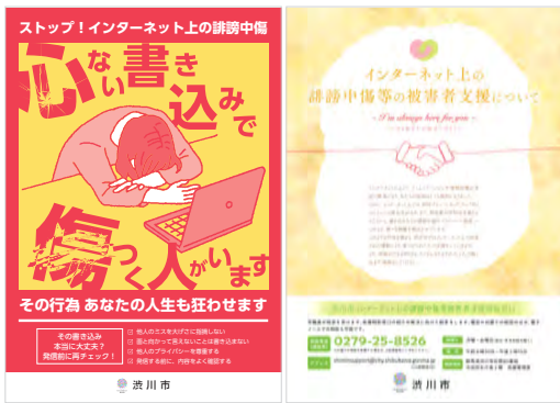
誹謗中傷の防止と被害者支援

情報防災部長 誹謗中傷等による人権侵害に対し、市の責務として、相談支援や弁護士費用の助成を実施し、被害者等を支援しています。