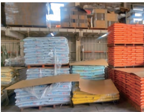
高騰を続ける農業用資材

市長 内容が事実であるかも把握しておらず、仮にそのような報道があったとすれば報道機関の対応としていかなものかと思えます。