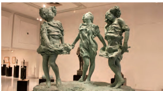
移転予定の美術品

質疑 屋外部分の常設展示をきれいに保つためには。 答弁 今までに引き続き、定期的な破損等の確認とともに汚れ等の確認をしていきます。