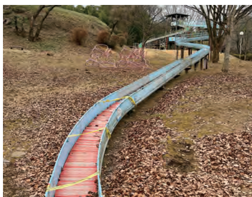
改修が待たれる沼尾川親水公園

質問 公園管理を福祉施設等に委託できないか。 建設交通部長 障がい者施設等への作業依頼の調査を行い、指定管理者と協議します。また、担い手不足の解消について研究します。