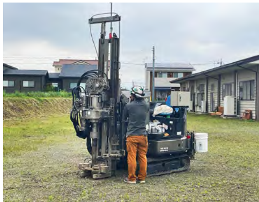
古巻公民館の土壌汚染調査始まる

質問 自治会役員はさまざまな負担が多く、なり手がいないとの声を聞くが、自治会の負担軽減につ