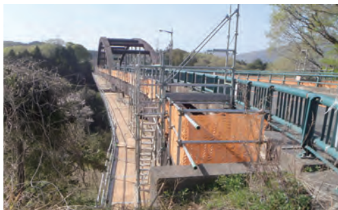
補修工事中の沼尾大橋

令和5年度沼尾大橋補修工事の総額を36億1,465万2,000円を追加し、それぞれの総額を36億1,465万2,000円に増