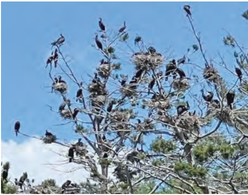
真壁調整池のカワウのコロニー

市長 限られた財源の中で、それぞれの地域の状況を見極めながら、市全体の中で優先順位をつけて、道路の整備を進めていきます。