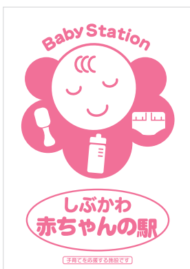
赤ちゃんの駅が目印となるステッカー

福祉部長 外出支援を目的に社会福祉協議会が運行する無料バス「福祉のあし」がだれでも広場を経由しますので移動手段の一つとしてご活用ください。