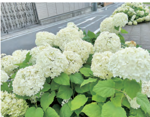
市の花あじさいも大切な観光資源

教育長 地域事情や保護者要望も踏まえながら一定の平等性を保ち、市の交通政策とともに安全を確保した上で、合理的な選択ができるよう検討を進めていきます。