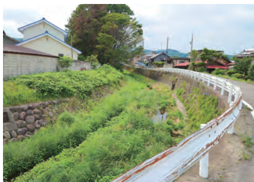
自治会の高齢化で除草作業ができない河川

建設交通部長 地域の皆さまには、ご協力をいただいています。一級河川管理は県です。市民から通