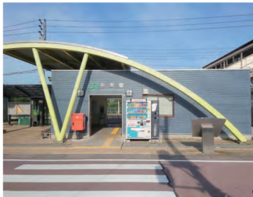
2024年に100周年を迎えるJR敷島駅