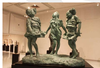
桑原巨守の集大成《春のよこび》