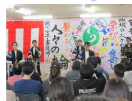
特別支援学校 和太鼓部