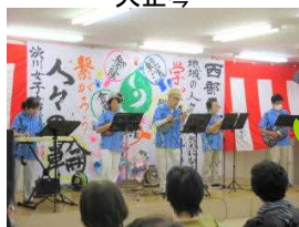
ハワイアンバンド