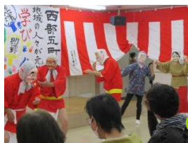
ひよっこおどり登場