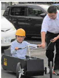
ソーラーカーを 試乗する小学生