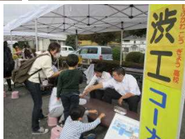
渋工 機械研究部 かわいいぐんまちゃん キーホルダー作成