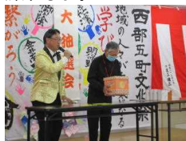
大抽選会 ファイナレは全員 参加の自治会長に よる大抽選会