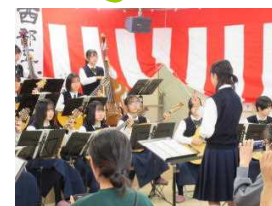
渋女 マンドリン部