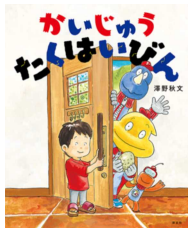
「かいじゅう わんはいびん」 澤野 秋文