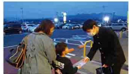
▲交通安全啓発マスコットの配布