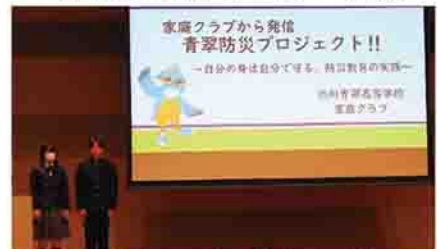
▲防災学習の成果発表会の様子