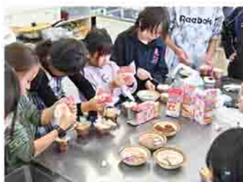
「昼あそび会」の様子

ヤマアソビKIDS CLUBは、「きょうだい児」(重い病気や障害のある子の兄弟姉妹)を支援するための遊び場として、令和3年10月から活動をしています。