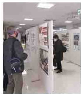
▲昨年は45団体を紹介