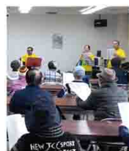
みんなで歌いましょう