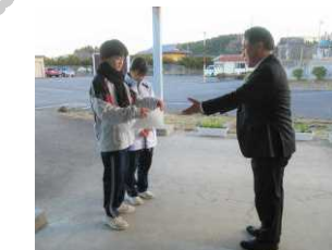
お手紙ありがとう