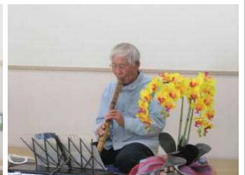
新春にふさわしい邦楽の曲を披露いただきました