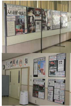
展示された三百年祭を記念するパネル