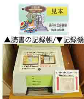
▲読書の記録帳/▼記録機

とき 3月1日(金)から ところ 北橋図書館、伊香保公民館、小野上公民館、子持公民館、赤城公民館、金島公民館、古巻公民館 詳しくは、市立図書館(☎20644)へ。