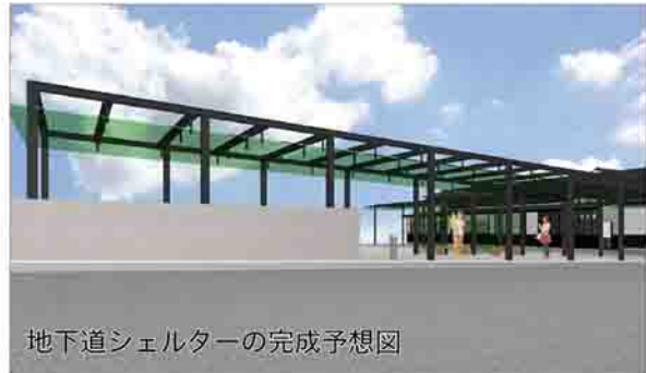
地下道シェルターの完成予想図

渋谷駅前広場において、地下道シェルター(屋根)のリニューアル工事を行います。工事期間中は1番線バス乗降場が変更となります。変更後の乗降場所は、案内看板などでお知らせします。工事期間中はご不便をおかけしますが、ご理解とご協力をお願いします。 工事期間 3月1日(金)～8月30日(金)(予定) 施工業者 ホクブ(株) 詳しくは、 ■都市政策課 (☎22073)へ。