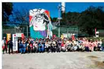
無線奉仕団の開局50周年記念 凧揚げ大会の様子

大同特殊鋼無線赤十字奉仕団は、現在76人が所属しており、趣味の無線を活用し、有事の際に他団体と協力して情報収集などの活動を行っています。日頃から訓練を実施し、日本赤十字や、県、市、自治会などの防災訓練にも参加しています。