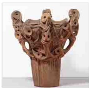
▲展示予定の焼町土器

今回の企画展では、眼鏡状の突起が特徴の「焼町土器」など約60点を年代順に展示します。1万年以上続いた縄文時代に作られた芸術的な土器を、ぜひ、ご覧ください。 とき 2月26日(月)～3月13日(水) 午前8時30分～午後5時15分(閉庁日を除く) ところ 市役所本庁舎市民