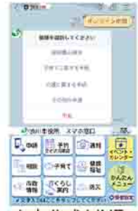
▲市公式LINE利用イメージ