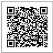
▲令和5年秋開始接種の詳細

▼12歳以上の人で第一三共社ワクチンの接種を希望する場合/生後6カ月～11歳の人でファイザー社ワクチンの接種を希望する場合 医療機関で直接予約を受け付けます。接種券を用意の上、電話などで予約してください。