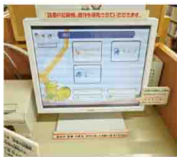
▲タッチパネル式の検索端末

市内他館の資料を取り寄せたり、借りたい資料をタッチパネル式の検索端末で検索することができます。