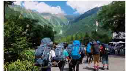
▲リーダー研修(北アルプス)

今年度は、引退した先輩の力もあり、関東大会に出場することができました。来年度は、今のメンバーで、県高校総体で1位をとれるよう、力を合わせて頑張ります。