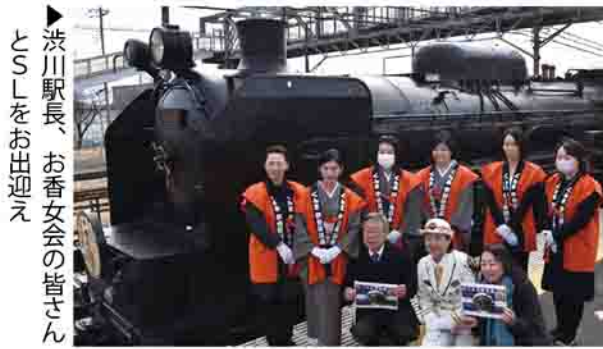
▶ 渋川駅長、お香女会の皆さんとSLSをお出迎え

2月17日、JR高崎駅と渋川駅の間に、初めて「SLS/ELSぐんま伊香保号」が運行されました。午前10時過ぎに、竹久夢二の美人