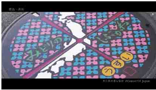
最優秀賞「#日本のまんなか」

動画の説明 観光地をリズミカルに紹介し、SNSで使用されるハッシュタグをテロップに入れることで、視聴者の検索意欲を湧かせるようにした作品です