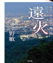
「遠火」 今野 敏