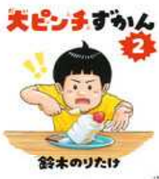
「大ピンチ ずかん 2」 鈴木のりたけ