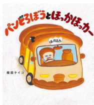
「パンどろぼ とほっかほ っかー」 澤野 秋文