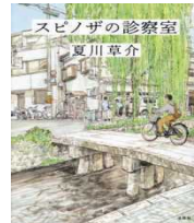
「スピノザ の診察室」 夏川 草介