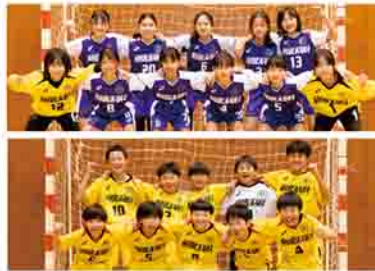
※このコーナーは今回で終了となります

とき ▷火・金曜日=午後6時30分～9時(低学年以下は午後8時まで) ▷土曜日(隔週)=午前9時～午後3時 活動場所 市総合公園体育館、大同特殊鋼渋川工場内体育館 対象 中学生以下(年長含む) 問合せ先 ■スポーツ課(TEL22241)