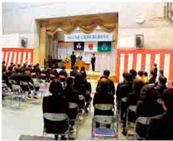
▲保護者や在校生の前で堂々と卒業証書を受け取る卒業生

「人の役に立ちたい」、「税金を納めて住みよい社会を作る一員になる」、「初めての給料で家族にごちそうがしたい」、「新しい仲間と仲良くしたい」など、明確な希望を持って、一人一人の進路先に向かって卒業しました。卒業生の代表による答辞では、保護者や地域の皆さんへの感謝の言葉が述べられ、在校生の送辞には、渋川特別支援学校の伝統を引き継ぐという気持ちが込められていました。