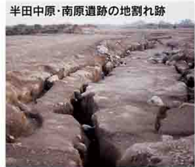
半田中原・南原遺跡の地割れ跡

▽古代社会の成立 ▽開発時代へ ▽古代の人々の暮らし ▽変わりゆく古代社会 観覧料 ▽大人 200円 ▽高校生・大学生 100円 ▽中学生以下 無料 その他 4月1日(月)から開館時間に変更になる場合があります。来館の際は、市ホームページ(ID 111070)で確認するか、電話で北橋歴史資料館へ問い合わせ