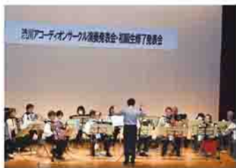
演奏発表会・初級生修了発表会

渋川アコーディオンサークルは、現在21人が所属しており、今年で創立55年目を迎えます。アコーディオンは、楽器1つでメロディー、ベース、コードを弾くことができ、歌謡曲やポピュラー、クラシックなど、さまざまな曲を演奏できます。