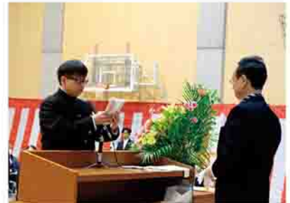
▲保護者や地域の人への感謝を込めた卒業生代表の答辞