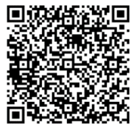
「東部給食カレンダー」 2次元コード

お知らせ 渋川市のホームページで毎日 の給食写真を掲載しております。 市のホームページや右記の2次 元コードからも見る事ができ ます。