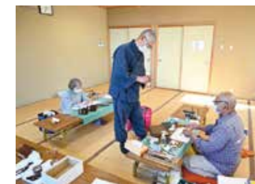
▲毎回真剣に作品の完成度を追求