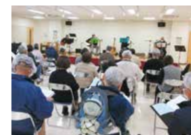
▲渋川公民館での定期ライブ

依頼があれば、どちらでも伺いますので、ぜひ、連絡してください。一緒に演奏したい人も歓迎しています。