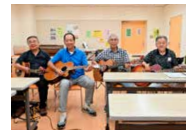
▲練習日のバンドメンバー