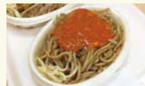
▲新潟名物?イタリアン

結婚を機に渋川へ来ました。当時、晴れた空の青の濃さや、山が近いことなど、新潟との自然環境の違いに驚いたものです。