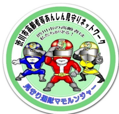
ステッカーのイメージ (直径9cm)

見守り活動がスムーズになるよう店舗用ステッカー、活動者用カード及び説明用パンフレット (別紙) をお配りしています。