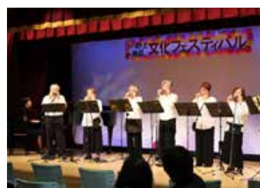
▲文化フェスティバルでの演奏