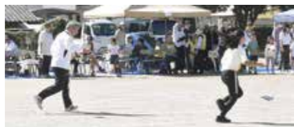
▲陸上魚釣りレースに参加!

秋は、文化祭や収穫感謝祭といったイベントが盛りだくさんです。猛暑の疲れを癒し、穏やかな実りの秋を満喫しましょう。