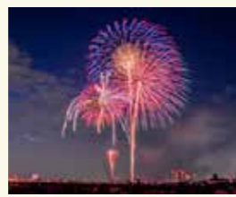
▲江戸川区の花火大会

江戸川区では、江戸川の河川敷で行われる花火大会が有名なほか、地域内にある江戸川スポーツランドは、夏はプール、冬はスケートリンクとして利用できる施設で、有名フィギュアスケーターがショーをやったこともあります。