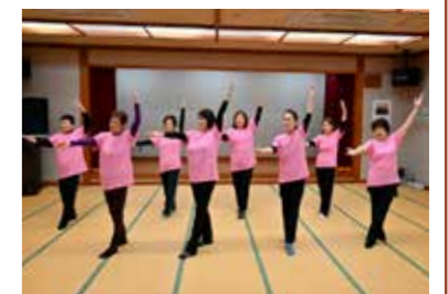
▲毎回楽しく練習しています