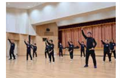
▲曲に合わせて練習

これからも楽しく、笑顔で続けたいと思っています。踊ることが好きな人の参加をお待ちしています。