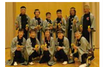
▲明るく楽しい仲間たちです