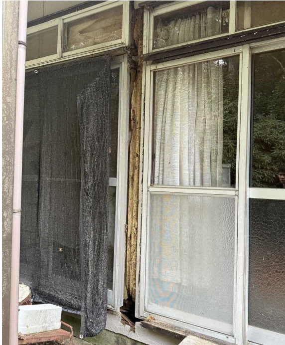
建物南側に一部柱の腐食あり