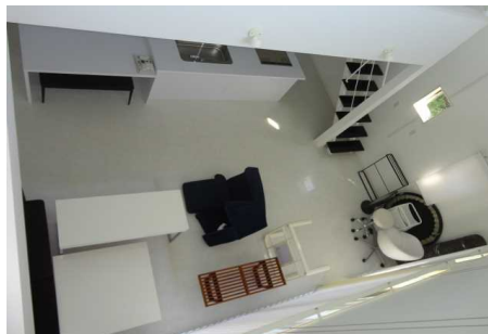
2階吹き抜けからの景色