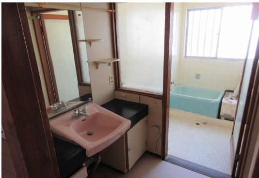
洗面所（洗面台要補修）