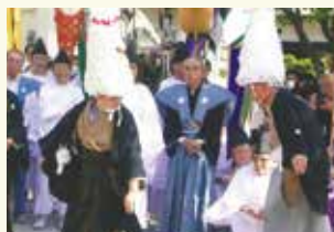
▲氷川神社「鶴の舞」奉納

ふるさと練馬区の氷川神社では、春の例大祭で「鶴の舞」が奉納されます。この舞は、江戸時代の元禄年間から伝わる伝統芸能で、鶴に扮した演者2人が、紋付きの羽織を広げて羽ばたくように舞います。五穀豊穡、子孫繁栄を願うとされ、私も行事を守り続けようと保存会の一員として関わり、長く鶴の舞手を務めていました。