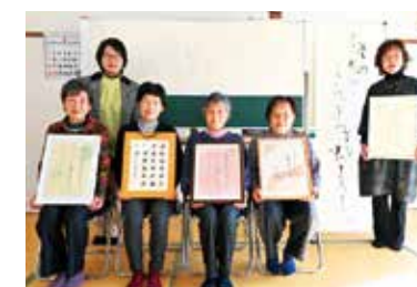
▲林先生とメンバーの皆さん